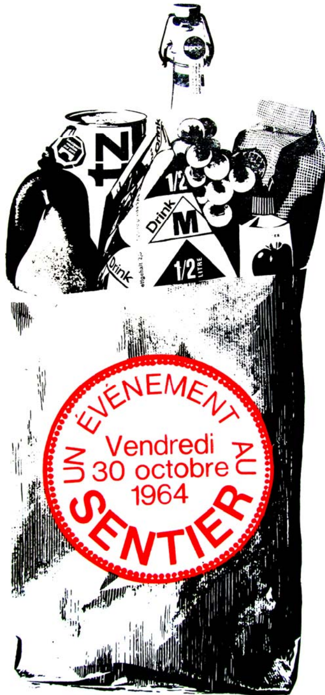
FAVJ du 28 octobre 1964 pour toutes les publicités.

REDACTION ET ADMINISTRATION Imprimerie Roland DUPUIS, Le Sentier Chèques postaux 11 4690